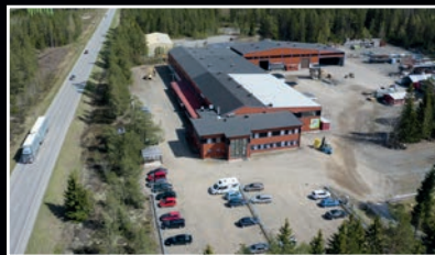
Lapijoen konepaja Nummitie 20 27150 EURAJOKI