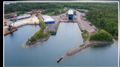
Olkiluodon telakka Satamatie 156 27160 EURAJOKI