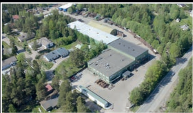
Kaaron konepaja Niilontie 1 26410 RAUMA