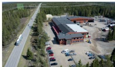
Lapijoen konepaja Nummitie 20 27150 EURAJOKI