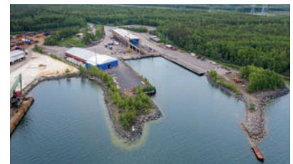
Olkiluodon telakka Satamatie 156 27160 EURAJOKI