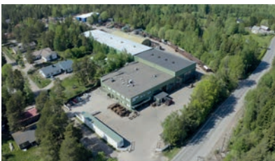
Kaaron konepaja Niilontie 1 26410 RAUMA

Asiakashyödyn tuottaminen. Joustavat ja tarkat toimitukset. Pitkäjänteinen ja kehittyvä toiminta. Hyvä työpaikka.